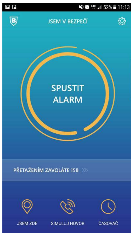
Náhled aplikace v mobilním telefonu