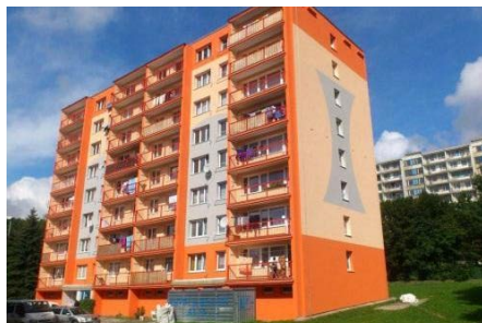
Různá kvalita bydlení v sociálně vyloučených lokalitách v Litvínově