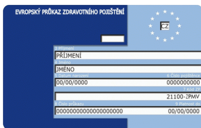
Obr. 1: EHIC

Protože po celou dobu, na kterou Vám byl vystaven formulář A1 , zůstáváte českými pojištěnci, můžete uplatňovat z území jiného členského státu nárok na některou z českých dávek nemocenského pojištění (nemocenské, peněžitá pomoc v mateřství, ošetřovné, vyrovnávací příspěvek v těhotenství a mateřství):