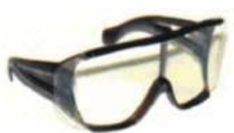
Obr. 1 - Brýle se stranicemi

Brýle jsou prostředkem na ochranu očí sestávajícím ze zorníků zasazených v brýlové obrubě se stranicemi, viz obr. 1. Brýle mohou být vybaveny postranními kryty, viz obr. 2. Zorníky mohou být čiré nebo s filtračními vlastnostmi, mohou krýt každé oko samostatně nebo obě oči zároveň. Zorníky mohou být z minerálních materiálů (skla), organických materiálů (plastu) nebo mohou být spojené z více vrstev (vrstvené).