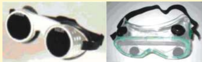
Obr. 3 - Příklady uzavřených ochranných brýlí

Uzavřené ochranné brýle, viz obr. 3, zakrývají oblast očí a těsně přiléhají k obličeji. Mohou být vybaveny systémem přímé nebo nepřímé ventilace. I tyto brýle mohou mít zorníky čiré nebo s filtračními vlastnostmi, vyrobené ze skla, plastu nebo vrstvené.