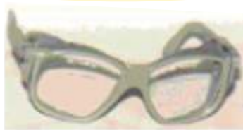
Obr. 2 - Brýle s postranními kryty

Uzavřené ochranné brýle, viz obr. 3, zakrývají oblast očí a těsně přiléhají k obličeji. Mohou být vybaveny systémem přímé nebo nepřímé ventilace. I tyto brýle mohou mít zorníky čiré nebo s filtračními vlastnostmi, vyrobené ze skla, plastu nebo vrstvené.