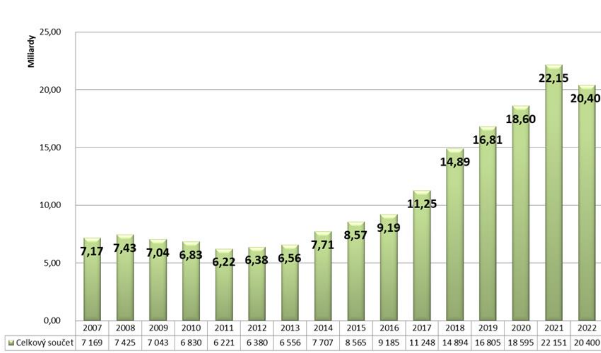
Graf č. 1: Vývoj celkových dotací v letech 2007-2022

Celkový počet služeb sociální prevence se oproti roku 2020 zvýšil, a to z 2 875 na 2963, čímž došlo k nárůstu celkové kapacity z 96 915 na 98 321 klientů. Současně s tím narůstá výše celkových dotací Ministerstva práce a sociálních věcí (dále jen „MPSV“) na zajištění sociálních služeb. V roce 2021 bylo oproti předchozímu roku vyplaceno o cca 4 mld. více (viz graf níže).