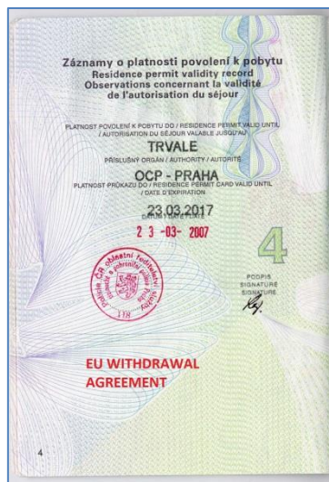
Obrázek 1: Potvrzení o přechodném pobytu se záznamem „EU withdrawal agreement“ Obrázek 2: povolení k pobytu se záznamem "EU withdrawal agreement"

Od 2. srpna 2021 pak bude Ministerstvo vnitra vydávat doklady s biometrickými údaji, na nichž bude figurovat poznámka „čl. 50 Smlouvy o EU“ resp. „RP UK – čl. 50 Smlouvy o EU“).