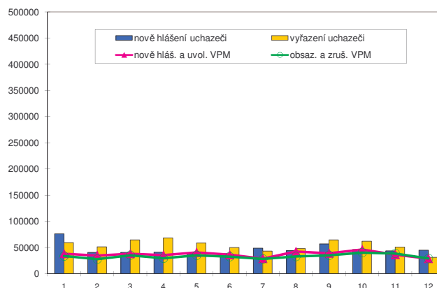
Nově hlášení a vyřazení uchazeči