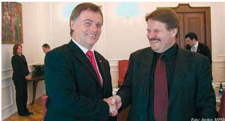
Ministr práce a sociálních věcí Zdeněk Škromach se setkal v Poslanecké sněmovně PCR s britským ministrem práce a penzí Andrewem Smithem, který věří, že nejen Velká Británie, ale i další země EU brzy otevrou volně pracovní trh pro české občany.

Samotná registrace je jednoduchá. Registrační formulář zašlete na adresu uvedenou na formuláři. Formuláře doručené osobně nebudou přijímány. Registrační formulář a adresu najdete na následující internetové adrese: www.workingintheuk.gov.uk . Registrační formulář vyplníte a posle-