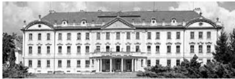
Tento rok oslavuje Diagnostický ústav sociální péče v Tloskově 45. výročí založení. Při této příležitosti proběhl 24. června 1. ročník „Dne otevřených dveří“ tohoto zařízení, na němž se návštěvníci mohli prostřednictvím bohaté foto- a videodokumentace seznámit s historií i současností ústavu.