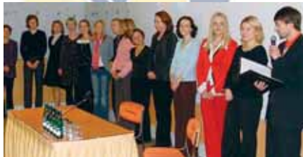
Na závěrečné konferenci Twinning EURES se představili všichni čeští EURES poradci

zhodnotili úspěšnost projektu. Náměstek ministra práce a sociálních věcí Čestmír Sajda zdůraznil, že hlavním výsledkem projektu