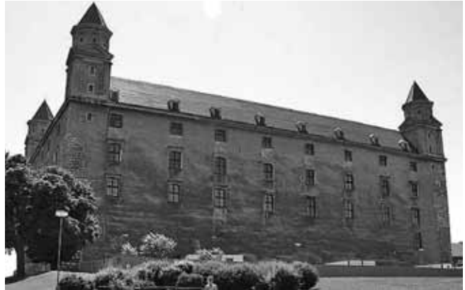
Je pro nás Slovensko správným příkladem?

Zatím je to tak, že právě Česká republika má mezi zeměmi EU nejmenší podíl chudých – jen 8 %. Naopak Slovensko, které nám dává mnoho našich liberálních ekonomů za vzor, je v čele zemí EU s podílem lidí žijících v chudobě. V roce 2002 žil každý pátý tamní obyvateľ v bídě. Myslí si ti, kteří tam vidí vzor pro české reformy, že za uplynulá dva roky