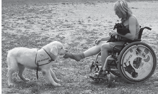
I když asistenční psi nedokážou plně nahradit osobní asistenci, výrazně handicapovaným usnadňují život

V podstatě je to stejné. Nároky na vodící a asistenční psy jsou úplně rovnocenné, psi musí splňovat stejné zdravotní i povahové vlastnosti. Výcvik trvá také zhruba stejně – šest až osm měsíců, někdy i rok. Cena se u nás pohybuje v průměru kolem 180 tisíc korun. Vodící psi jsou uznáni jako kompenzační pomůcka, asistenční psi ale ne. V jejich případě dostáváme na práci s klientem, tedy na platy lidí, kteří se točí kolem přípravné i následné péče – podporu od Ministerstva práce a sociálních věcí ČR. Co se týče psa – od jeho nákupu přes veterinární péči až po odevzdání klientovi, tak tato část je hrazena ze sponzorských darů a veřejných sbírek.