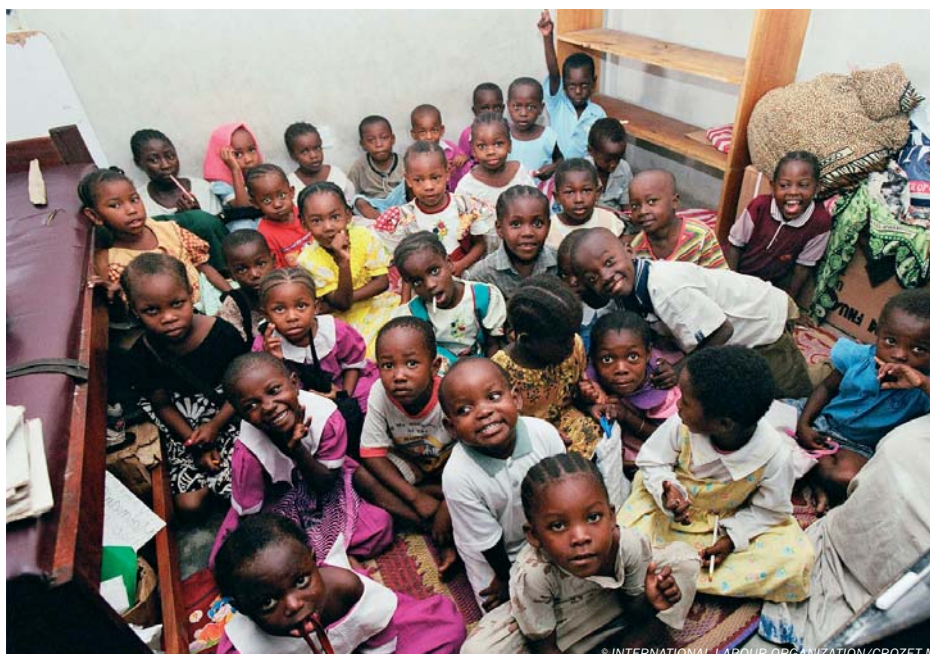
Tyto děti, kterým umřeli rodiče na AIDS, navštěvují základní školu centra Kiwohede v největším městě Tanzanie Dar Es Salaam. Kiwohede je jedna z organizací zapojených do programu na odstranění dětské práce (IPEC), jehož garantem je Mezinárodní organizace práce (ILO).

V roce 2000 byla na Mezinárodní konferenci práce přijata rezoluce, která navazovala na předchozí iniciativy v Africe a vytvořila předpoklady pro globální program zaměřený na