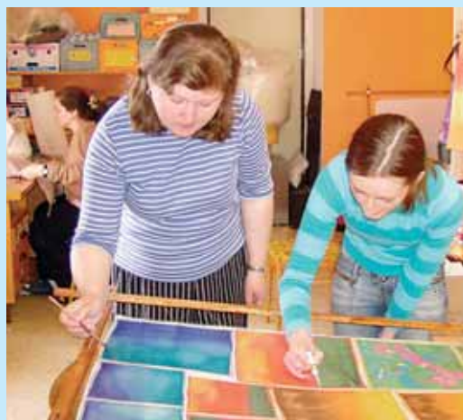
(TR) Malování na hedvábné – práce v dílně.

Posláním, se kterým Středisko NINIVE bylo zakládáno, je „doprovodit člověka se zdravotním postižením na jeho cestě k nejvyšší možné formě zaměstnání dle jeho přání, možností a schopností“.