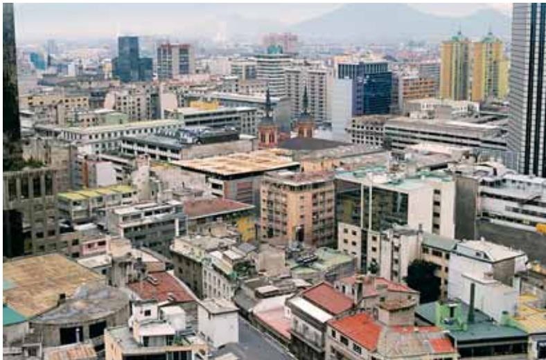
SANTIAGO DE CHILE

Jednou z klíčových změn, kterou reforma důchodového systému přinesla, bylo nové chápání významu „odchodu do důchodu“. Každý se může svobodně rozhodnout, kdy přestane pracovat a odejde do důchodu, pokud má na svém individuálním účtu naspořené dostatek prostředků. Nashromážděný kapitál musí stačit k vyplacení důchodu po celý zbytek života podle naděje na dožití (ve věku odchodu do důchodu). Aby výše důchodu nebyla při brzkém odchodu do důchodu příliš nízká, musí kapitál stačit na „průměrný důchod“. Pokud pracovníkovi zbývá do důchodového věku méně než 10 let, je průměrný důchod roven polovině průměrné mzdy za posledních 10 let, pokud je zároveň tato hodnota vyšší než 110 % minimálního důchodu. Pro odchod do důchodu v ještě nižším věku je hodnota průměrného důchodu stanovena o něco přísněji. Ten, kdo splnil tyto podmínky a již začal pobírat důchod, může i nadále pracovat a nemusí už odvádět pojistné. Zákon stanoví důchodový věk na