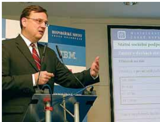
RNDr. Petr Nečas při prezentaci reformních návrhů.

Vláda jednomyslně schválila návrh reformy, která má zastavit roztáčející se spirálu katastrofálního zadlužování státu. Její poslání je jednoznačné – pracovat se vyplatí víc než si chodit pro sociální dávky. Sociálně citlivá reforma navrhuje některé dávky omezit a výměnou nabízí snížení daní. Reforma veřejných financí má pro příští rok snížit schodek veřejných rozpočtů o více než 40 miliard.