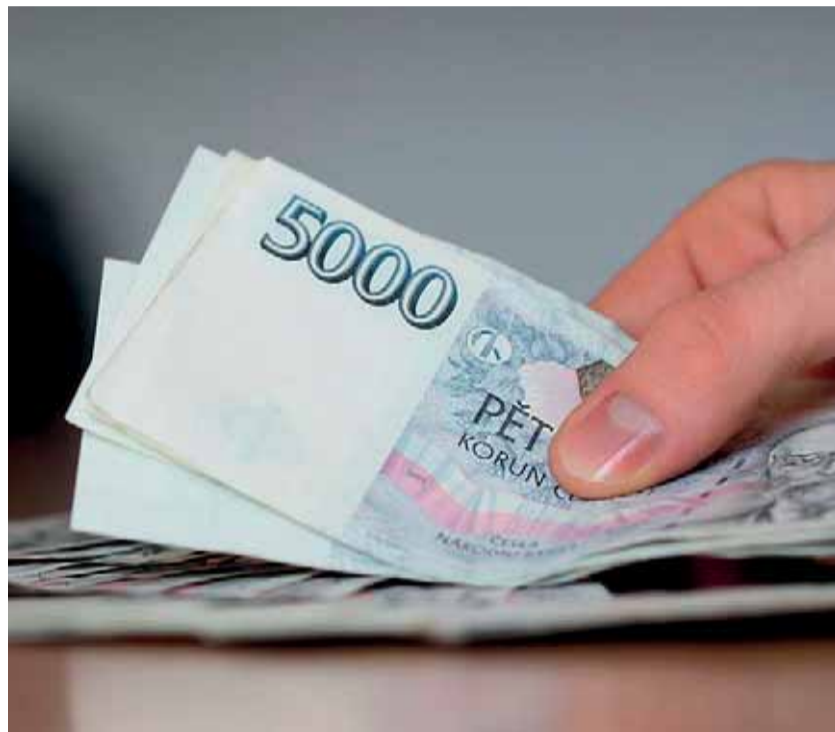
Sociální reforma má především snížit náklady na administraci systému.