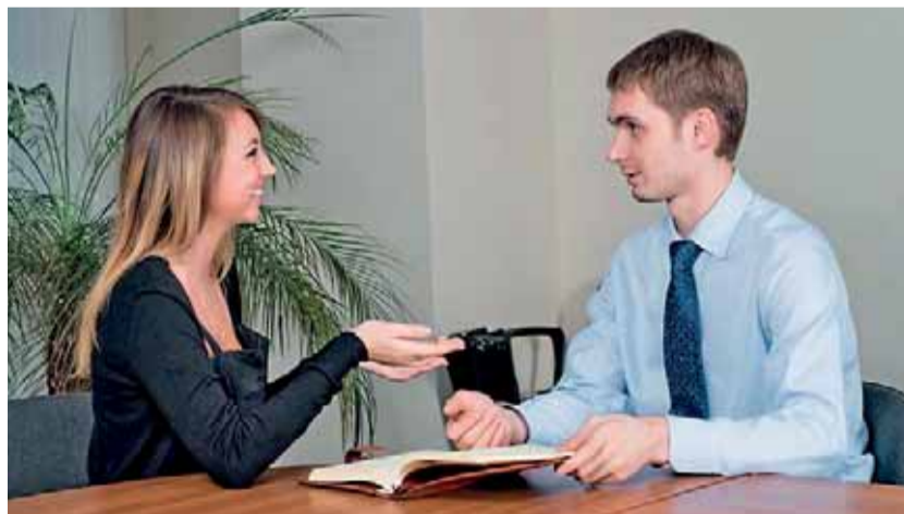
Kariérový poradce úřadu práce se postupně stává osobním koučem, který vytváří a udržuje aktivitu a motivaci uchazeče.

Faktem je, že uchazeči hledají zaměstnání jen v určitých životních etapách a vstup na trh práce pro ně znamená nejen novou, ale často také nepřijemnou situaci. Většina z nich o zaměstnání bezpochyby stojí. Na druhou stranu vstupují do zcela nového prostředí a očekávání, že se v něm budou ihned perfektně orientovat, je také poněkud nereálné. Řada z nich hledá práci metodou „pokus – omyl“ a není se až tak čemu divit, když svůj následný neúspěch na něho svaluje. Skutečnou odpovědnost za nalezení zaměstnání však nese výhradně uchazeč a je na něm, zda tuto odpovědnost dokáže přijmout.