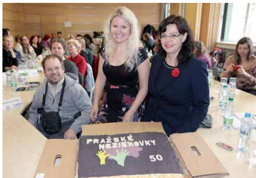
Při oslavě 50. dílu seriálu Pražské neziskovky se ministryně Michaela Marksová setkala se zástupci více než 40 neziskových organizací pečujících o handicapované.

Seriál příběhů s názvem Pražské neziskovky oslavil již padesáté pokračování. Projekt, který měl představit veřejnosti práci pražských neziskových organizací skrze životy a osudy konkrétních lidí, začal jako sympatický, skromný pokus, který se však za velmi krátkou dobu rozrostl.