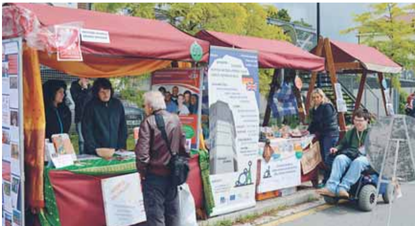
Na festivalu v Hradci Králové se na více než šedesáti výstavních stáncích představili veřejnosti poskytovatelé sociálních a dalších souvisejících služeb ve východočeském regionu.