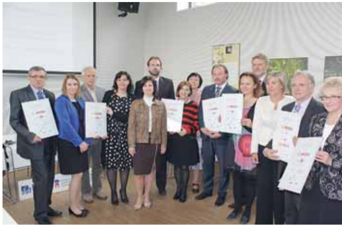
V jihomoravské metropoli byly také vyhlášeny výsledky letošního ročníku soutěže Obec přátelská rodině. Vítězové získali diplomy a šeky s příslibem neinvestiční dotace.