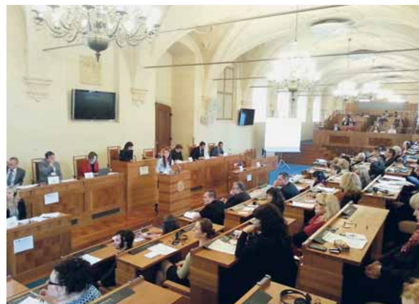
Závěrečná konference k možnostem zaměstnávání absolventů sociálně orientovaných oborů se konala v rámci projektu Otevřené dveře na trh práce a pod záštitou místopředsdkyně Senátu Parlamentu ČR Mgr. Miluše Horské.