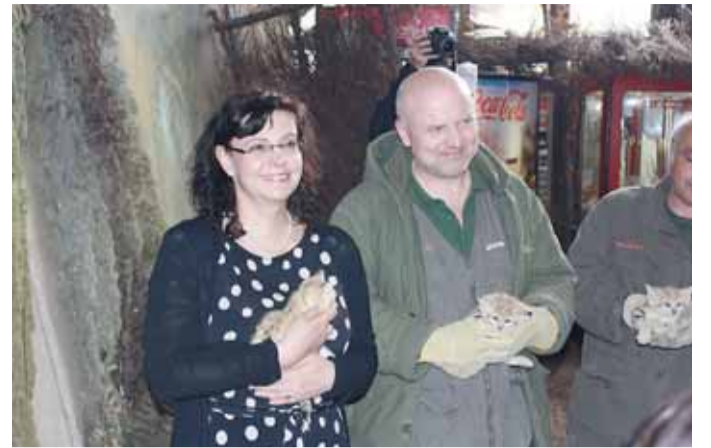
V rámci akce pro rodiny s dětmi, která se konala ve stejný den v brněnské zoologické zahradě, pokřtila ministryně práce a sociálních věcí Michaela Marksová mláďata kočky pouštní.