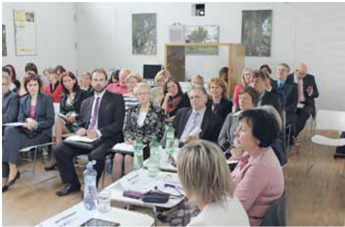
Kulatého stolu, který se konal v Brně 15. května na téma podpora rodin, se zúčastnili i zástupci státní správy a nestátního neziskového sektoru ze Slovenska, Polska a Maďarska.