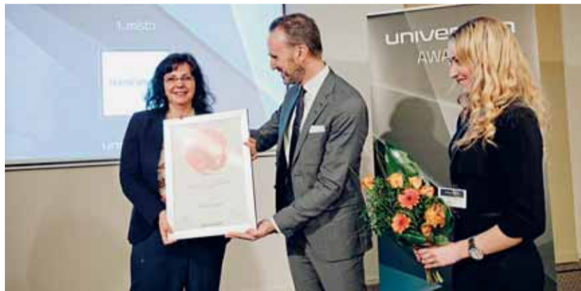
Státní správa se v průzkumu Universum Awards 2015 stala nejatraktivnějším zaměstnavatelem v kategorii Law. Ocenění převzala ministryně práce a sociálních věcí Michaela Marksová.

Průzkum Universum je největším kariérním nástrojem svého druhu na světě. Zohledňuje názor více než 700 000 studentů a absolventů ve 28 zemích světa včetně České republiky. Výsledkem průzkumu je žebříček Czech Republic's Most Attractive Employers (dříve TOP 100 IDEAL Employers), tedy žebříček nejatraktivnějších zaměstnavatelů v zemi podle preferencí studentů vysokých škol v České republice. Žebříček je sestavován podle studijních oborů v pěti kategoriích. Ve dvou se letos významně umístila státní správa: V kategorii Business obsadila 4. místo a kategorií Law dokonce vyhrála.