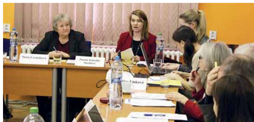
Odborná komise pro rodinnou politiku, složená ze zástupců Ministerstva práce a sociálních věcí ČR, Českého statistického úřadu, Výzkumného ústavu práce a sociálních věcí a z odborníků z oblastí sociologie, demografie či ekonomie, jednala 17. února mj. o lepší dostupnosti služeb péče o děti.