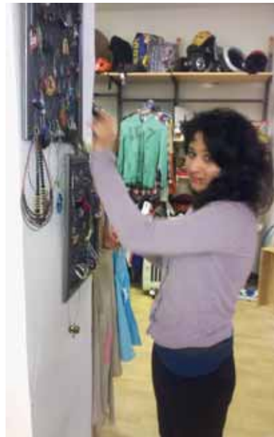
V Restart Shopu v pražské Biskupské ulici získávají potřebnou pracovní praxi klienti nízkoprahových zařízení pro děti a mládež.

Česká asociace streetwork, která projekt realizuje od začátku letošního roku, se inspirovala v Belgii, Nizozemsku a Anglii, kde poskytovatelé sociálních služeb takováto pracoviště provozují zcela běžně. „Mladí lidé pocházející z jiného sociokulturního prostředí mají z důvodů své odlišnos-