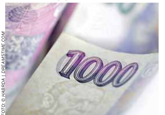
Srážky z dávek nemocenského pojištění v letech 2013 a 2014