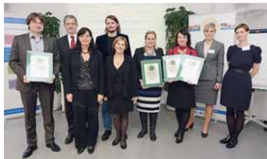
Výsledky celorepublikového kola soutěže Společnost přátelská rodině pro rok 2015 byly vyhlášeny na konferenci Síť mateřských center, která se konala 27. listopadu v prostorách Era světa na Jungmannově náměstí v Praze. Ocenění předali ministryně Michaela Marksová a ministr Jiří Dienstbier.