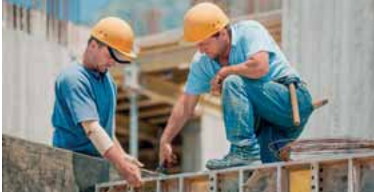
Nejvíce nelegálně zaměstnaných osob bylo při kontrolách zjištěno ve stavebnictví.

Od 1. ledna do 20. listopadu letošního roku uskutečnili inspektoři práce 8 095 kontrol zaměřených na odhalení nelegální práce, při nichž bylo zjištěno 2 446 nelegálně pracujících osob.