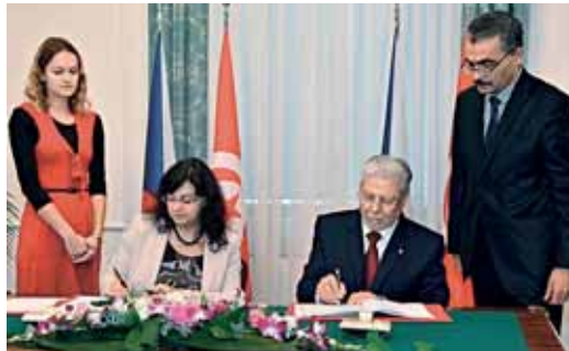
Smlouva o sociálním zabezpečení mezi Českou a Tuniskou republikou, kterou podepsali ministryně práce a sociálních věcí Michaela Marksová a tuniský ministr zahraničí Taïeb Baccouch, usnadní pohyb pracovníků, podnikání a poskytování služeb mezi oběma zeměmi.

Ministryně práce a sociálních věcí Michaela Marksová podepsala 20. listopadu na Úřadu vlády ČR s tuniským ministrem zahraničí Taïebem Baccouchem smlouvu o sociálním zabezpečení mezi Českem a Tuniskem.