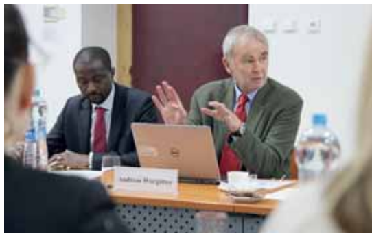
Členy delegace OECD, která 20. listopadu jednala na Ministerstvu práce a sociálních věcí ČR, byli i vedoucí strukturální mise OECD Andreas Wörgötter (vpravo) a ekonom Fatilou Fall.

Členy mise OECD zajímaly hlavně odlišnosti českého prostředí ve srovnání s okolními zeměmi. Kromě Ministerstva práce a sociálních věcí ČR jednali i s dalšími zainteresovanými ministry a řadou dalších institucí včetně např. České národní banky a zástupců sociálních partnerů.