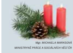
Mgr. MICHAELA MARKSOVÁ MINISTRYŇE PRÁCE A SOCIÁLNÍCH VĚCÍ ČR