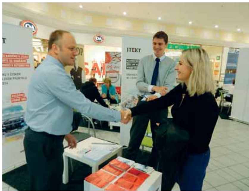
Veletrhy JOBfest nabízejí možnost setkat se s personalisty firem, kteří nabízejí v daném regionu zaměstnání, ve známém a nestresujícím prostředí obchodních center.

Už vás nebaví posílat životopis a čekat na odpověď? Přijďte rovnou za zaměstnavateli a nabídněte se. Kam? Navštívit můžete například prezentační veletrhy pracovních příležitostí JOBfest.