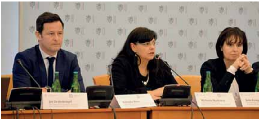
Ministryně Michaela Marksová moderovala jednu z diskuzí na konferenci o budoucnosti trhu práce.

V Černínském paláci v Praze se 25. listopadu konala mezinárodní konference, která řešila budoucí podobu pracovních trhů v evropském i celosvětovém kontextu.