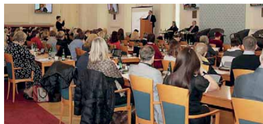
Konference 22 % k rovnosti se konala v pražském Černínském paláci.

Rozdíl v odměňování žen a mužů činí v České republice 22,5 procenta. V otázkách rovného odměňování je Česká republika druhou nejhorší