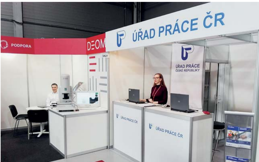
Na veletrhu nechyběl ani stánek Úřadu práce ČR, kde se mohli zájemci informovat o službách, které úřad klientům poskytuje.