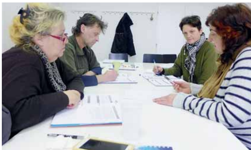
V rámci projektu PROKOP se vybraní klienti Úřadu práce ČR účastní vzdělávacích aktivit zaměřených na zvýšení jejich finanční a občanské gramotnosti a zlepšení osobních dovedností.

Mezi účastníky projektu PROKOP je většina těch, kteří se dostali do velmi obtížných situací. Potýkají se například s exekucí, ztrátou bydlení, nemohou nalézt práci kvůli zdravotnímu omezení nebo třeba nedosta-