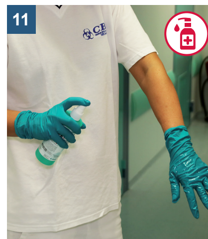
11 Dezinfikujte rukavice.