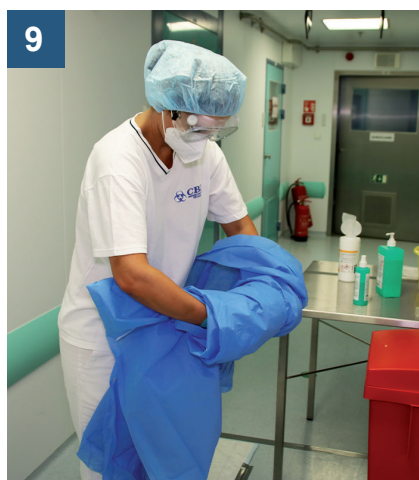
9 Plášť pomalu rolujte.