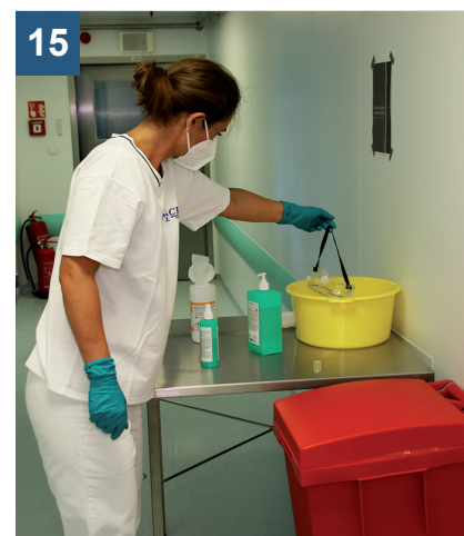
15 Ochranné brýle i štít jsou často určeny k opakovanému použití.