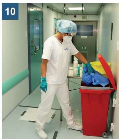
10 Použité OOPP v odpadní nádobě nestlačujte, hrozí riziko víření infekčního aerosolu.