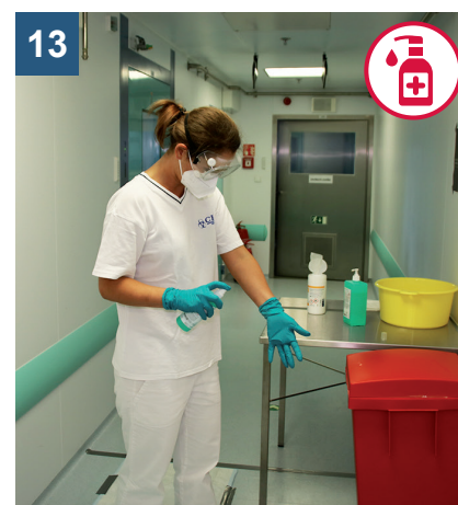
13 Dezinfikujte rukavice.