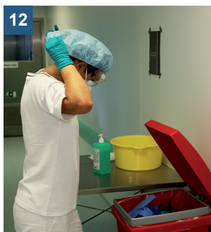
12 Sundejte čepici pomalým tahem zezadu dopředu.