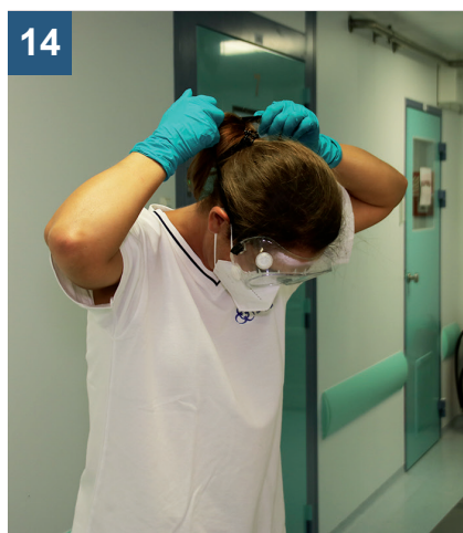
14 Zavřete oči a pomalu zezadu dopředu za gumičky sundejte ochranné brýle nebo štít. Rukavicemi se nedotýkejte vnější plochy brýlí a obličeje.