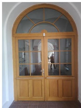
Vstup na chodbu s WC 200cm