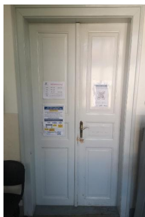
Dveře do kanceláří 3 NP 140cm