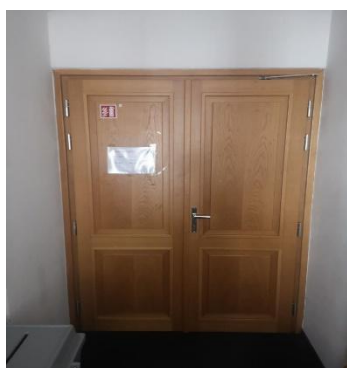
dávky pro osoby se zdravotním postižením – 140cm