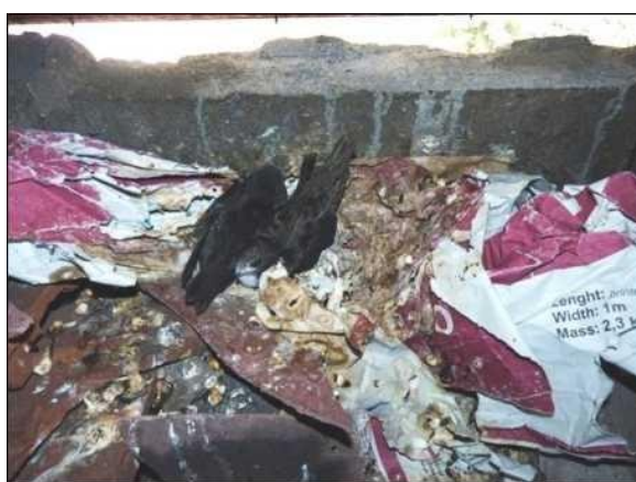
Hnízdo rorýse obecného s mláďaty