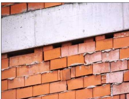
Poškození neomítnutého zdiva - obvyklý, úkryt ptáků i netopýrů