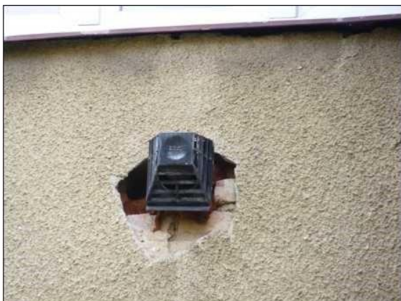
Nezačištěné okraje odvětrání podokenního hnízdiště rorýse obecného