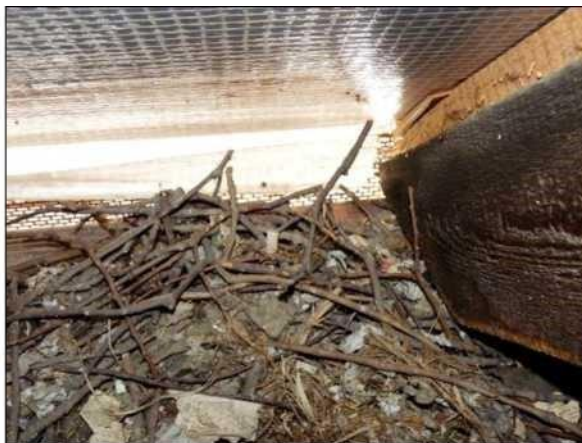
Hnízdo kavky se skládá z hrubšího materiálu, převážně větvíček dřevin rostoucích v okolí