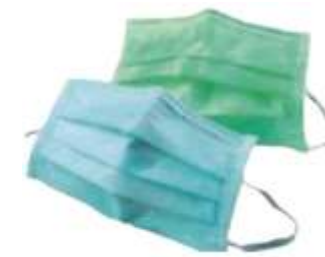
Obr. 3 - Lékařská rouška

Tato rouška nepatří mezi OOP a nesmí být proto označena symbolem CE ani příslušnou třídou. Varovným signálem může být i nápadně nízká cena.