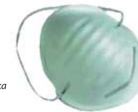
Obr. 4 - Hygienická rouška