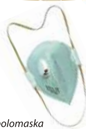
Obr. 2 Filtrační polomaska s ventilkem