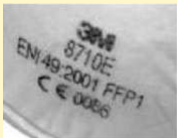
Obr. 5 - Označení filtračních polomasek

Výrobek musí být vždy doplněn návodem na používání. V návodu musí být srozumitelně popsány vlastnosti filtrační polomasky a způsob použití.