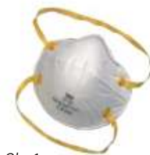
Obr. 1 Filtrační polomaska bez ventilku

Dostupné jsou i polomasky s aktivním uhlím, zachycující rovněž obtěžující pachy, plyny a páry v koncentracích nepřevyšujících NPK/PEL 2 . Tyto prostředky jsou obvykle určeny pro jednorázové použití. Vždy je potřeba seznámit se s návodem na jejich používání.