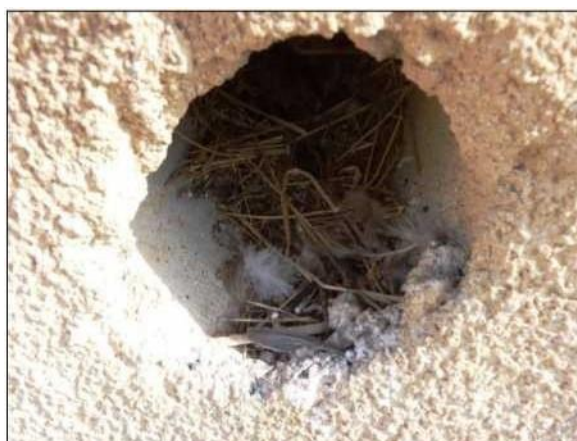
Hnízdni materiál, vypadávající z hnízda vrbců