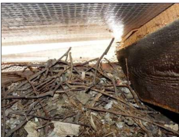
Hnízdo kavky se skládá z hrubšího materiálu, převážně větvíček dřevin rostoucích v okolí