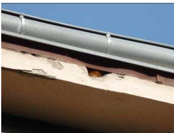
Detail poškození římsy – vletový otvor do hnízda