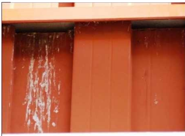
Prostor pod vletovým otvorem pěvců je často znečištěn trusem