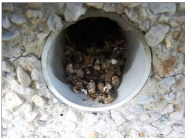
Trus rorýse obecného v ústí ventilačního otvoru