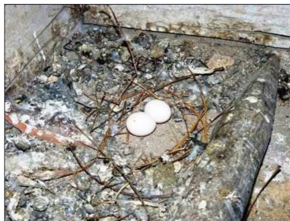
Hnízdo holuba věžáka je většinou nedokončené