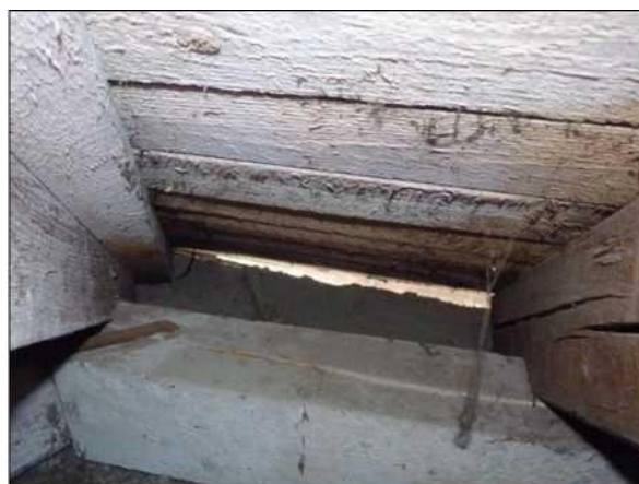
Prostor za pozednicí nejčastější hnízdiště synantropních ptáků