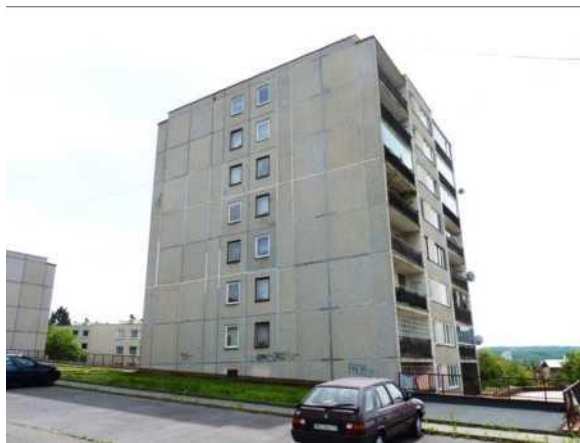
Panelový bytový dům