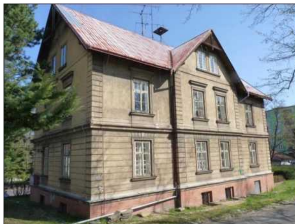
Bytový dům se sedlovou střechou