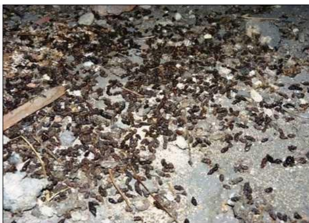
Trus netopýrů se často hromadí na podlaze půdy, na okenních a balkónových parapetech i v dutinách nebo větracích kanálcích plochých jedno a dvouplášťových střech