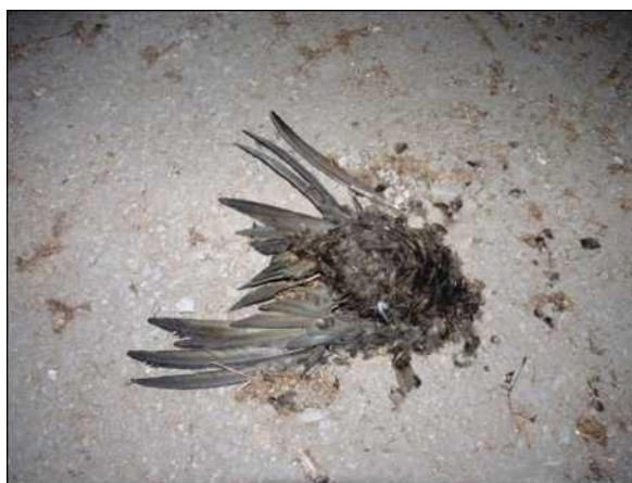
Uhynulý rorýs na podlaze půdy