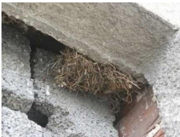
Hnízda vrabců obsahující velké množství hnízdního materiálu