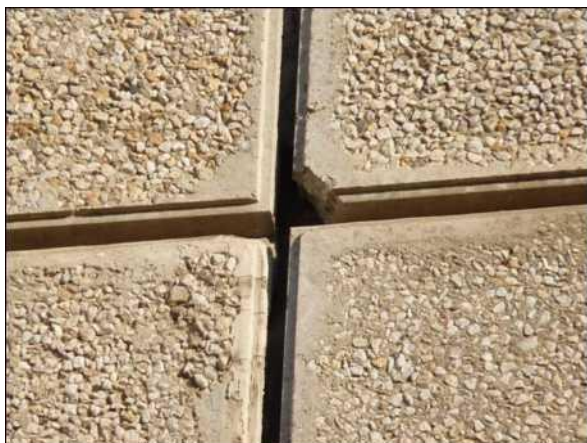
Volné spáry mezi panely