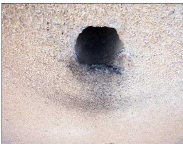
Znečištění fasády pod ventilačním otvorem způsobené otěrem rýdovacích per pěvců