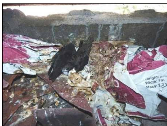
Hnízdo rorýse obecného s mláďaty