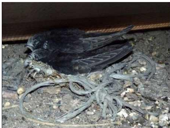
Rorýsi často hnízdo nestaví, spokojí se s materiálem, který v dutině naleznou