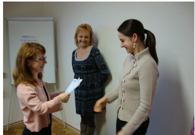
Obrázek 3: Zakončení vzdělávání - předávání osvědčení

Účastníci vzdělávání absolvovali teoretickou část vzdělávacího programu především v prostorách Hotelu Krystal v Praze 6 - Veleslavíně, ve kterém je možné využít kromě seminárních prostor i ubytování a stravování. Praktická část vzdělávacího programu byla sestavena jednak z inspekcí, kdy jeden, maximálně dva, inspektoři měli k dispozici v průběhu inspekce v místě lektora, se kterým mohli inspektoři jednak konzultovat svá zjištění, použití inspekčních metod, zjišťování důkazů, formulaci zjištění do inspekční zprávy, ale také od něho obdrželi zpětnou vazbu k sebereflexi dovedností nezbytných pro výkon inspekce. Druhou, neméně důležitou, aktivitou praktické výuky byly tzv. peer skupiny (viz Newsletter č. 15). Inspektoři se rozdělili do skupin s maximálně osmi účastníky a naplánovali si dvě setkání, která probíhala bez přítomnosti lektora. Inspektoři na základě zadání se na prvním setkání zamýšleli nad přípravou na inspekci, nad možnými riziky sociálního začleňování osob dle § 2 zákona o sociálních službách, nad oblastmi, kde by bylo možné omezení nebo porušení práv uživatelů dané služby. Na druhém setkání inspektoři reflektovali průběh inspekce, na kterou se připravovali v rámci prvního setkání peer skupiny.