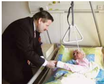
Místopředseda vlády a ministr práce a sociálních věcí Ing. Zdeněk Škromach při návštěvě hospice Citadela ve Valašském Meziříčí