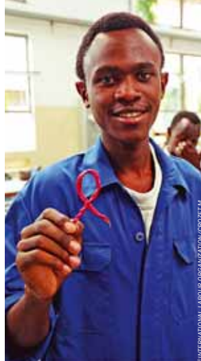
INTERNATIONAL LABOUR ORGANIZATION/CIOS/ETM

Psycho-sociální problémy pracovníků mohou snadno přerůst v onemocnění, úrazy, stigmatizaci nebo izolaci. Z hlediska zaměstnavatele mohou mít také značné negativní dopady – vyšší nemocnost a úrazovost, sníženou produktivitu, nižší morálku, zvýšené sazby pojištění apod.