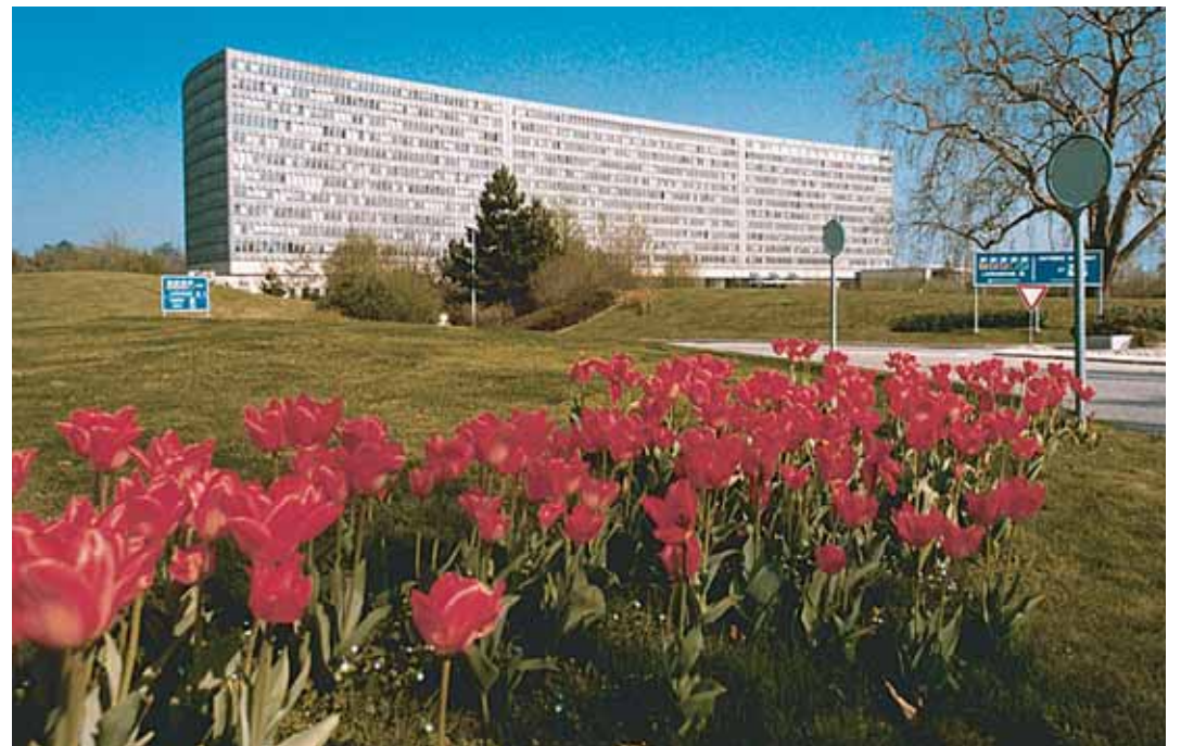
Sídlo Mezinárodní organizace práce v Ženevě