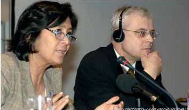
Globalizace, práva pracovníků, program a rozpočet na období 2006–07 byly hlavními body letošního jarního zasedání správní rady ILO. Jako zvláštní host se diskuse o strategích na podporu spravedlivé globalizace při respektování základních práv pracovníků zúčastnil komisař Vladimír Špidla.

Ten má na starosti tento okruh problémů v Evropské komisi, konkrétně otázky zaměstnanosti, sociálních věcí a rovných příležitostí.