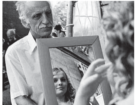
Jedna z vystavovaných fotografií od autorky L. Nimcové

V ambitu kláštera františkánů na pražském Jungmannově náměstí probíhá do konce června výstava fotografií s názvem „Pořád jsem to já“. Na snímcích českých a slovenských fotografů jsou zachyceni seniori v různých životních situacích a při rozličných aktivitách. Jak uvedli autoři