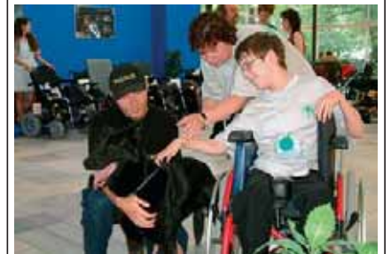
I letos bude v rámci Dnů zdravotně postižených VIVAT VITA předvedena práce vodících a asistenčních psů

Už patnáctý ročník veletrhu kompenzačních, rehabilitačních, protetikých pomůcek a služeb pro zdravotně postižené se koná na výstavišti Flora v Olomouci ve dnech 23.–25. června. Představí se zde desítky vystavovatelů – výrobců a prodejců z celé České republiky. Jejich nabídkou doplní prezentace aktivit humanitárních organizací a občanských sdružení. Součástí veletrhu bude 4. konference poskytovatelů sociálních služeb Olomouckého kraje. S veletřem je spojen i 2. ročník národního projektu HANDICAPÁDA. Jeho obsahem bude prodejní výstava výtvarných prací zdravotně postižených občanů, dále „Dny sportu, her a zábavy bez bariér“, tvůrčí dílny s nabídkou zajímavých programů pro volný čas, pěvecká divadelní a taneční vystoupení osob s postižením na téma „Podívejte, co umíme a jak žijeme“, módní přehlídka „Móda pro handicapované“, poradna pro život s postižením „Paragrafik“ atd. Na výstavišti se bude konat část soutěží v rámci Memorálu MUDr. Vladimíra Knapka, což je celorepublikové sportovní setkání vozíčkářů, konané na počest MUDr. V. Knapka, lékaře a rehabilitačního odborníka, propagátora organizovaného sportu osob užívajících vozík. (TR)