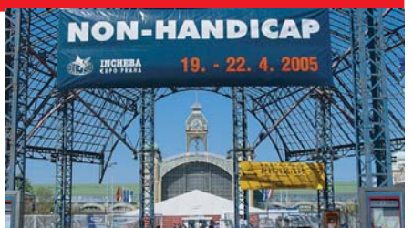
Organizátorem veletrhu NON-HANDICAP 2005 byla společnost Incheba Praha a odborný doprovodný program zajišťovalo občanské sdružení zdravotně postižených ORFEUS.

Příjemným zpestřením veletrhu byla také ukázka dovednosti psů cvičených pro pomoc handicapovaným. Jejich šikovnost předvedli pracovníci Centra výcviku psů pro postižené HELPPES.