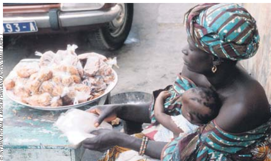
INTERNATIONAL LABOUR ORGANIZATION/AMILLARY