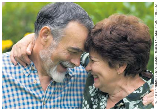
Každý z nás si přeje prožít podzim života v pohodě a spokojenosti.

Od té doby uběhly další roky, aniž bylo dosaženo dalšího konsenzu. Ministerstvo práce a sociálních věcí ČR připravilo v září 2007 návrh parametrických změn zákona o důchodovém pojištění a ještě v prosinci se zdálo, že kompromisní dohoda bude možná minimálně na bázi koaličních stran a ČSSD. ČSSD však vznesla další podmínky, které zkomplikovaly rýsujiící se kompromis. Hraje se přitom o čas. Každý rok prodlení může ohrozit životní úroveň budoucích důchodců. Nelze už déle čekat, jedná se příliš dlouho bez hmatatelných výsledků. Ministr práce a sociálních