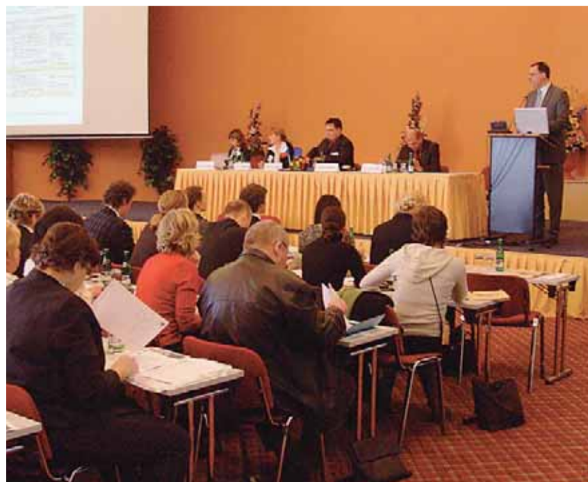
Na úvod celostátní konference k projektu System kvality v sociálních službách zvolil systém inspekce místopředseda vlády a ministr práce a sociálních věcí Petr Nečas.

Kromě přípravy nových inspektorů byl projekt zaměřen také na průběžné vzdělávání všech specializovaných odborníků – inspektorů kvality sociálních služeb, které musí externí