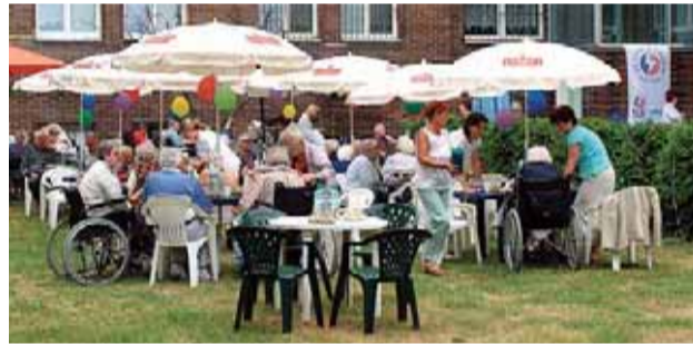
Zahradní slavnost v kladenském Domově pro seniory.

V Domově pro seniory bydlí 146 klientů a město každoročně dotuje jeho provoz. „Předloni to byla částka