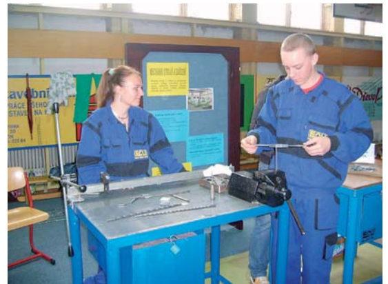
Žáci středních škol ve spolupráci s partnerskými firmami připravili pro návštěvníky ukázky jednotlivých profesí.