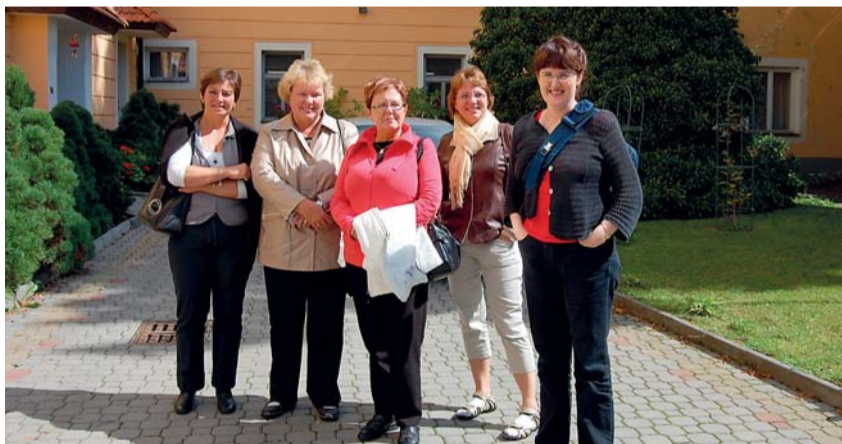
Pětičlenná islandská delegace navštívila i domov pro seniory v jihočeském Chýnově.

V první polovině září strávilo v ČR sedmidenní studijní pobyt pět odborníků na sociální služby z Islandu. Šlo o druhou aktivitu projektu Asociace poskytovatelů sociálních služeb České republiky (APSS ČR) a islandské partnerské organizace Soltun Nursing Home s názvem Komparace služeb sociální péče o seniory .