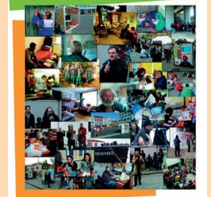
2010 Evropský rok boje proti chudobě a sociálnímu vyloučení