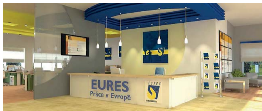
Ve virtuálním stánku EURES byli klientům k dispozici poradci EURES. Závěreční si také mohli mj. stahovat všechny dokumenty potřebné pro práci v zahraničí.