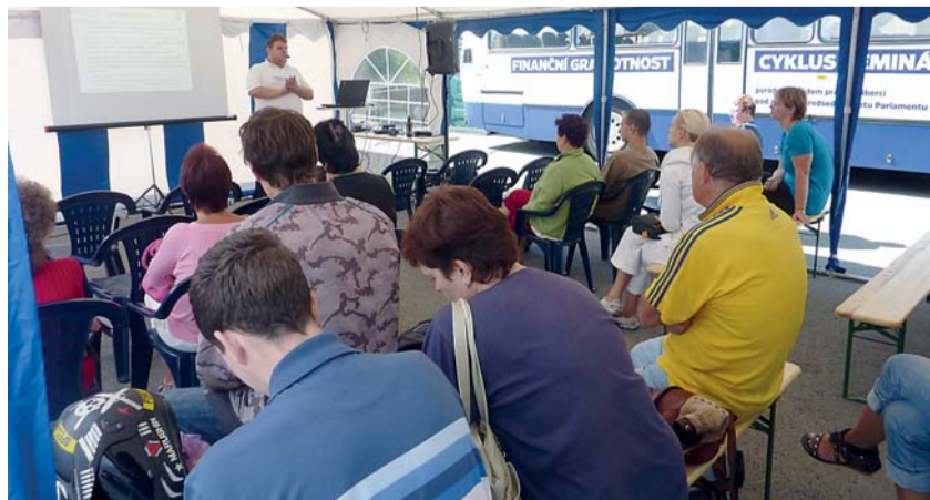
Cílem seminářů Úřadu práce v Liberci na téma finanční gramotnost bylo zvýšit povědomí o nástrahách finančního světa.