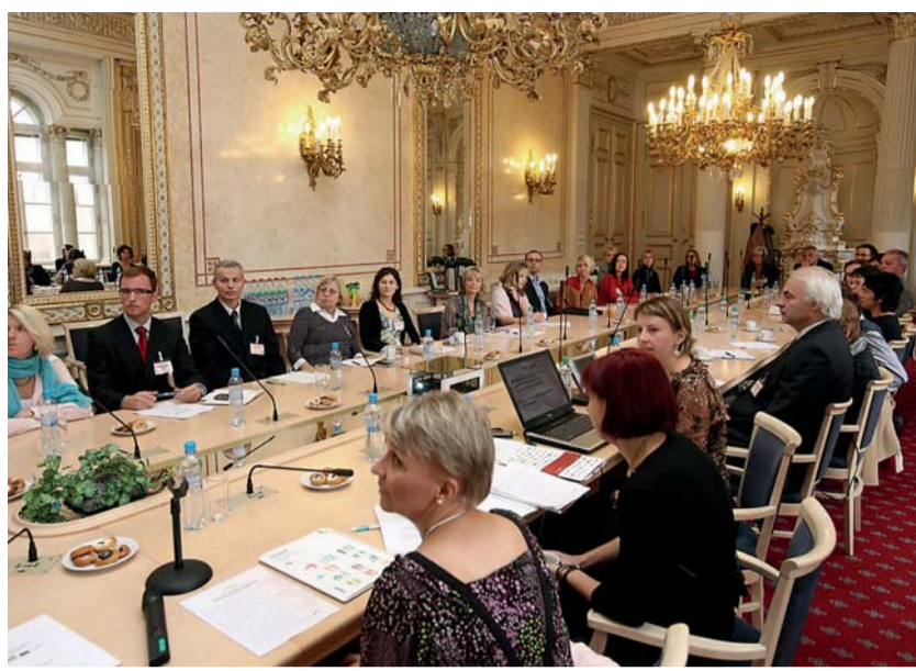
Vyhlášení a předání cen soutěže Národní cena kariérového poradenství 2010 proběhlo ve Velkém zrcadlovém sále Ministerstva školství, mládeže a tělovýchovy ČR.

2. místo: Úřad práce v Náchodě s příspěvkem Pravidelné střední poradenské schůzky pro evidované klienty