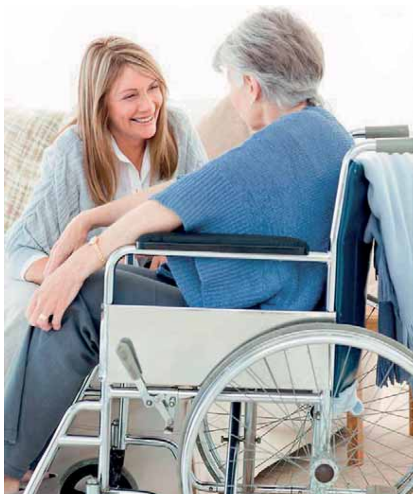
Zavádí se institut tzv. asistenta sociální péče. Jedná se o jinou než blízkou osobu (např. soused), která není registrovaným poskytovatelem sociálních služeb.