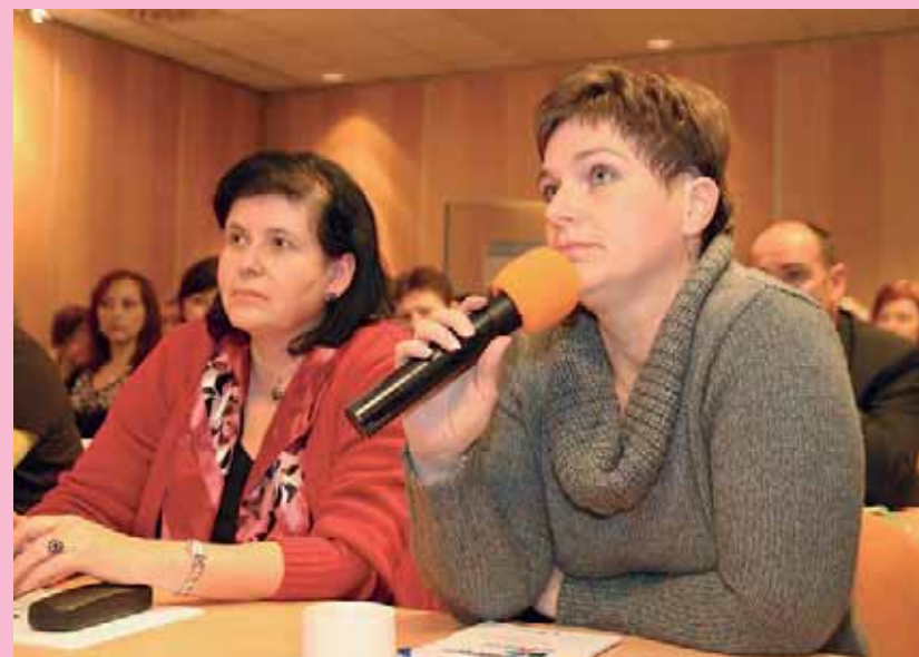
Jeden ze seminářů na téma sociální reforma a změny od 1. ledna 2012 se konal v polovině listopadu v Brně. Při diskusi zodpovídali odborníci z MPSV a Úřadu práce ČR dotazy státních zaměstnanců, zástupců samospráv i neziskového sektoru.

dotazy či vysvětlit nejasnosti i v souvislosti se sociální reformou. Veškeré tyto komunikační aktivity jsou hrazeny z ESF. (RED)