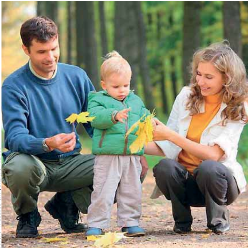
Rodiče si budou moci podle svých aktuálních potřeb změnit určenou výši rodičovského příspěvku a tím i délku jeho čerpání jednou za tři měsíce.

Sociální reforma počítá se zavedením Karty sociálních systémů, pomocí které se bude občan prokazovat při kontaktu se systémy spravovanými MPSV. Karta bude sloužit jako průkaz osoby se zdravotním postižením. S její pomocí budou moci zdravotně handicapovaní čerpat stejné výhody, jaké mohou čerpat dnes při předložení průkazu TP, ZTP nebo ZTP/P v současné papírové podobě. Zavedením karty dojde ke značným úsporám na straně výplaty dávek a zároveň z karty bude na úřadě možné vyčíst informace o dávkách již přiznaných, popřípadě informace rozhodné pro přiznání dávek nových. Karta může sloužit jako karta platební. Dávky si bude možné vybrat z bankomatu, kartou bude možné platit v obchodě a bude možné s ní platit i převodem na účet. Kartou bude vydávat Úřad práce ČR. Banka ji bude vyrábět v souladu s mezinárodně uznávanými předpisy, které se vztahují na bankovní karty. Bude tedy obsahovat běžné ochranné prvky. Za vydání karty příjemce