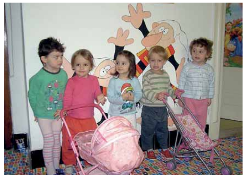
Na Ministerstvu práce a sociálních věcí ČR fungují v pilotním provozu dvě tzv. dětské skupiny. První využívají rodiče a děti od července 2011, druhá nabízí služby od února letošního roku.

Právní předpis o tzv. dětské skupině vychází z programového prohlášení vlády. Ministři se v něm zavázali, že podpoří rozvoj alternativních předškolních zařízení a budou vytvářet podmínky pro rychlejší návrat rodičů pečujících o děti do práce. (TZ)