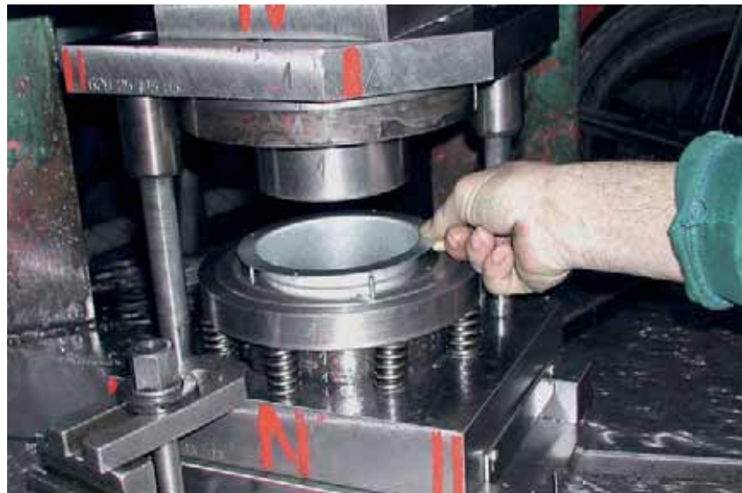
Jeden z příkladů nebezpečných způsobů práce na tvářecím stroji.

Z výše uvedeného důvodu je proto ze strany oblastních inspektorátů práce v rámci jednoho z hlavních úkolů věnována mimořádná pozornost kon-