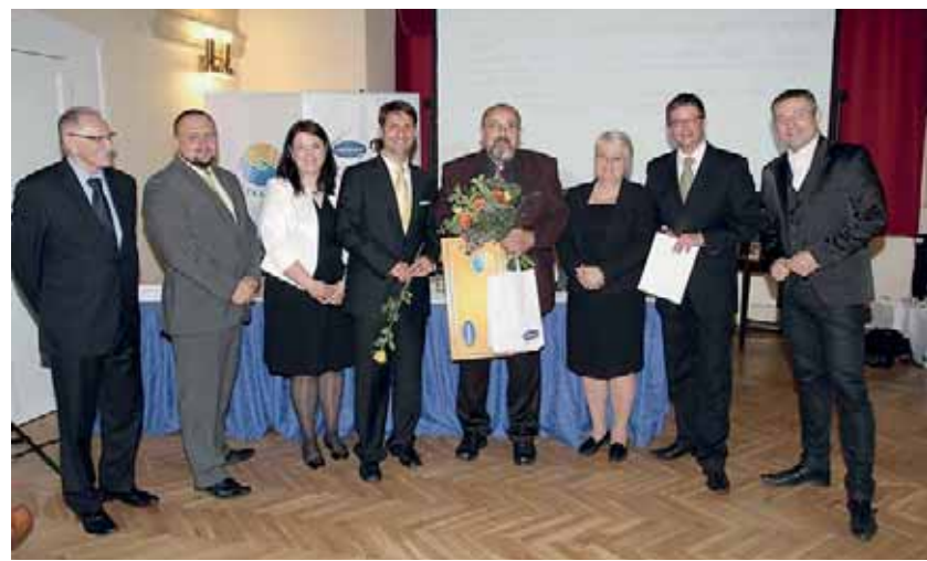
Ocenění Dobrá duše v kategorii Instituce získal Dům Sv. Antonína z Moravských Budějovic.

„Na ministerstvu si velmi uvědomujeme význam sociálních služeb, včetně dobrovolnictví,“ nastiňuje