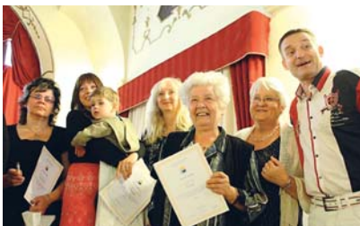
O dobrou náladu se při předávání certifikátů Dobrá duše postaral i patron projektu zpěvák, moderátor a bavič Vladimír Hron.

Odborná komise složená ze zástupců partnerů projektu letos hodnotila zejména stálost zapojení dobrovolníků, jejich kreativitu a celkové nadšení pomáhat. Sami účastníci projektu hovoří o tom, že na dobrovolnictví se dali hlavně proto, aby podpořili svoje vrstevníky. Takovouto pomoc bere většina z nich jako samozřejmou a přirozenou činnost. Projekt by měl pokračovat i v příštím roce. (TZ)