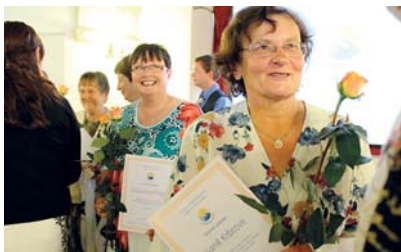
Projekt Dobrá duše má za cíl ocenit aktivní seniory, kteří poskytují pomoc těm, kdo nemají dostatečně rodinné zázemí nebo zůstali sami.