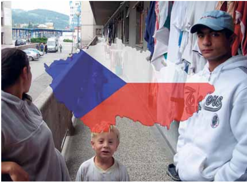
Poslední mapování sociálně vyloučených lokalit bylo realizováno v roce 2005.

V červenci začalo velké terénní šetření, které probíhá ve více než dvou stovkách vytípaných obcí na celém území ČR, a to s cílem zjistit, jaká je v nich míra sociálního vyloučení a s čím se musí lidé žijící v takovém prostředí vyrovnávat.