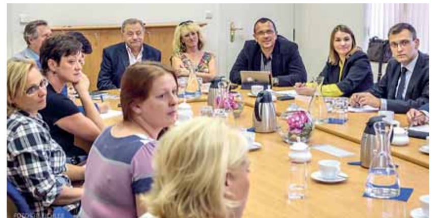
Jak na setkání se zástupci samosprávy i nespokojených občanů uvedla náměstkyně ministryně pro sociální a rodinnou politiku Zuzana Jentschke Stöcklová (druhá zprava), díky novele zákona o sociálních službách budou moci obce a města zaměstnat více sociálních pracovníků, kteří pomohou řešit situaci v sociálně vyloučených lokalitách nejen v Děčíně.