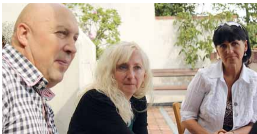
Se způsobem péče o seniory v městské části Praha 1 seznámila Janu Hanzlíkovou, náměstkyni pro ochranu práv dětí a sociální začleňování (uprostřed), starosta Prahy 1 Oldřich Lomecký a ředitelka Střediska sociálních služeb Prahy 1 Helena Čelišová.

Náměstkyně ministryně pro ochranu práv dětí a sociální začleňování Jana Hanzlíková přijala 25. srpna pozvání k návštěvě Střediska sociálních služeb městské části Praha 1. Průvodce jí dělali ředitelka příspěvkové organizace Helena Čelišová a starosta městské části Praha 1 Oldřich Lomecký. „V rámci práce na Národním akčním plánu pro pozitivní stárnutí populace jsem se chtěla seznámit i se způsobem péče o seniory v hlavním městě. Přivítala jsem přístup zaměstnanců zdejšího střediska, které se snaží seniorům připravit přirozené prostředí, na něž byli celý život zvyklí a zároveň jim poskytovat služby, které respektují jejich osobnost a potřeby,“ říká náměstkyně Jana Hanzlíková. Prvním místem, kde se náměstkyně Jana Hanzlíková zastavila, byl Dům s pečovatelskou