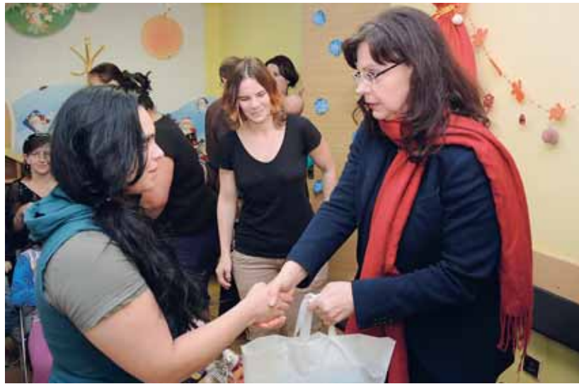
Ministryně práce a sociálních věcí Michaela Marksová navštívila 22. prosince plzeňský Domov sv. Zdislavy pro matky s dětmi v tísni. Setkala se s maminkami a jejich dětmi a předala jim potravinové balíčky v rámci projektu Potravinová a materiální pomoc nejchudším osobám.

Není jednou z mnoha výhod mikrojeslí rychlejší návrat matek do práce?