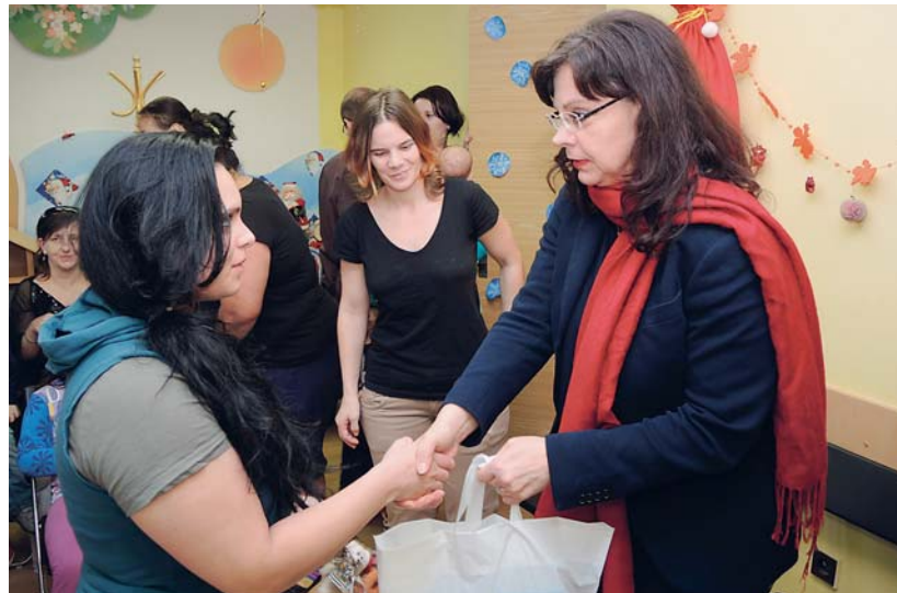
Ministryně práce a sociálních věcí Michaela Marksová navštívila 22. prosince plzeňský Domov sv. Zdislavy pro matky s dětmi v tísni. Seděla se s maminkami a jejich dětmi a předala jim potravinové balíčky v rámci projektu Potravinová a materiální pomoc nejchudším osobám.

Není jednou z mnoha výhod mikrojeslí rychlejší návrat matek do práce?