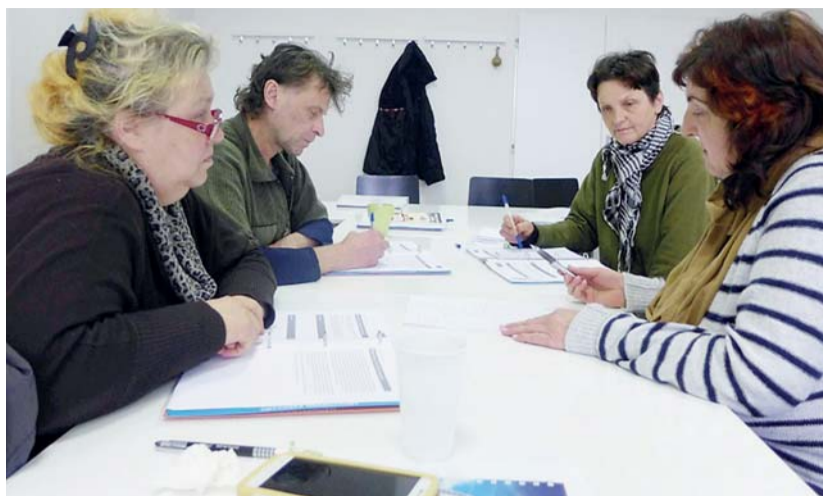
V rámci projektu PROKOP se vybraní klienti Úřadu práce ČR účastní vzdělávacích aktivit zaměřených na zvýšení jejich finanční a občanské gramotnosti a zlepšení osobních dovedností.

Mezi účastníky projektu PROKOP je většina těch, kteří se dostali do velmi obtížných situací. Potýkají se například s exekucí, ztrátou bydlení, nemohou nalézt práci kvůli zdravotnímu omezení nebo třeba nedosta-